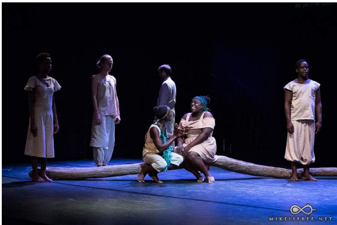
Le Songe d'une autre nuit, mis en scène par Jacques Martial

Les nouveaux stagiaires comédiens et techniciens du spectacle vivant suivent actuellement leur première année de formation, et ressortiront diplômés en juin 2017. Un stage probatoire en octobre 2015 permettra notamment aux inscrits encore scolarisés d'intégrer la formation dès le début de la deuxième année, sous conditions et en suivant des sessions de remise à niveau.