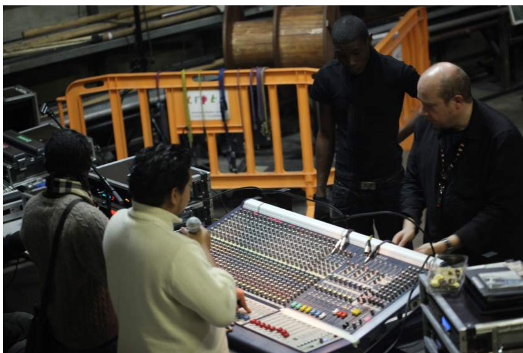
Régie son d'un concert dans les locaux du CFPTS, Voyage d'étude 2013

Pour les stagiaires techniciens, c'est l'occasion de passer des habilitations et d'apporter une complémentarité à la formation dispensée à Saint-Laurent du Maroni : CACES, formation incendie, modules son et lumière sur un matériel à la pointe de la technologie.