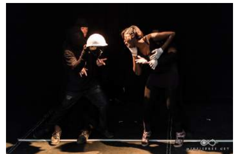
Atelier Théâtre Noir, Tréteaux du Maroni 2014

Lors de la première promotion, une stagiaire comédienne a été distribuée dans le court métrage « Révélation Intimes » réalisé par Cédric Ross, et deux stagiaires techniciens ont été régisseurs lumière et son pour le journal télévisé mis en place par AVM dans le cadre du Festival les Cultures Urbaines.