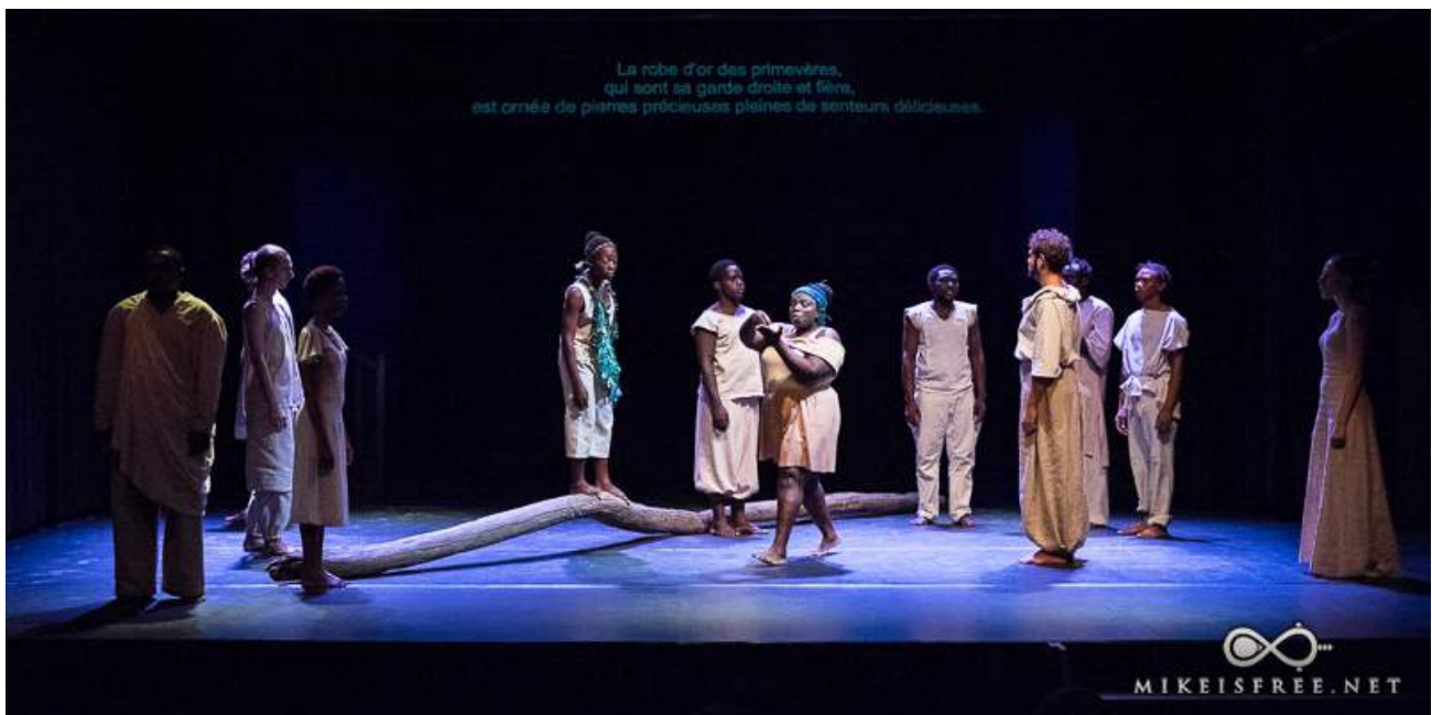
Le Songe d'une autre nuit, spectacle tremplin professionnel de la première promotion du TEK

Les comédiens diplômés du TEK sont maintenant des professionnels menant leurs projets de front : trois comédiens ont créé leur compagnie dont la deuxième création sera en représentation durant le Festival des Tréteaux du Maroni, deux sont artistes associés à un projet pédagogique autour du conte mené au lycée Bertène Juminer, deux ont été embauchés par l'IFSL une demi-journée pour des saynètes d'évaluations de médiateur, une comédienne a tourné dans un court-métrage, la quasi totalité des comédiens diplômés ont été auditionnés pour le court-métrage Madame Cléante n'ira pas au cimetière dont le tournage est prévu en juin 2015, ainsi que pour une série télévisée produite par Canal Plus et prochainement tournée en Guyane.