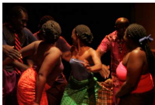
L'Os, création Compagnie KS and CO

aux techniques de la scène reconnues et réputées pour leur excellence et leur exigence.