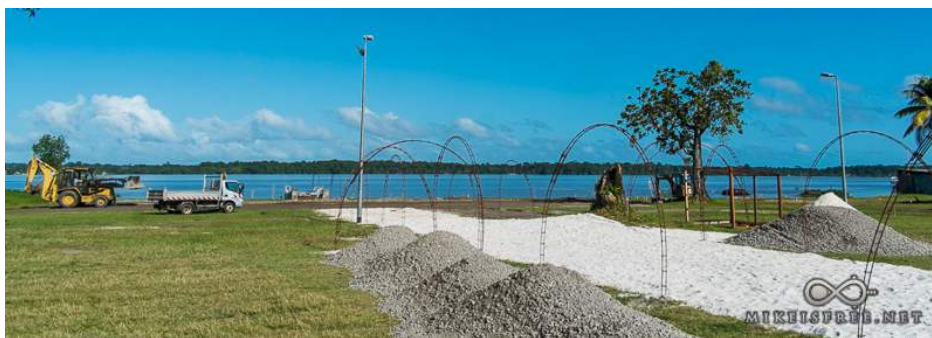
Installations techniques d'Une Iliade, auxquelles ont participé de nombreux partenaires du TEK

Les relations professionnelles et/ou pédagogiques de confiance établies entre le TEK et ses différents partenaires institutionnels, sociaux et culturels, en font une structure plus que jamais ancrée dans l'Ouest Guyanais. Ancrage dont bénéficient évidemment les stagiaires du Théâtre Ecole Kokolampoe, via une proximité et un échange avec les partenaires sociaux, culturels et institutionnels.