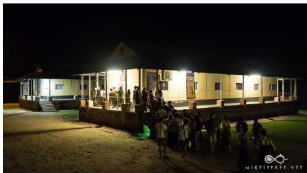
Les Tréteaux du Maroni 2014